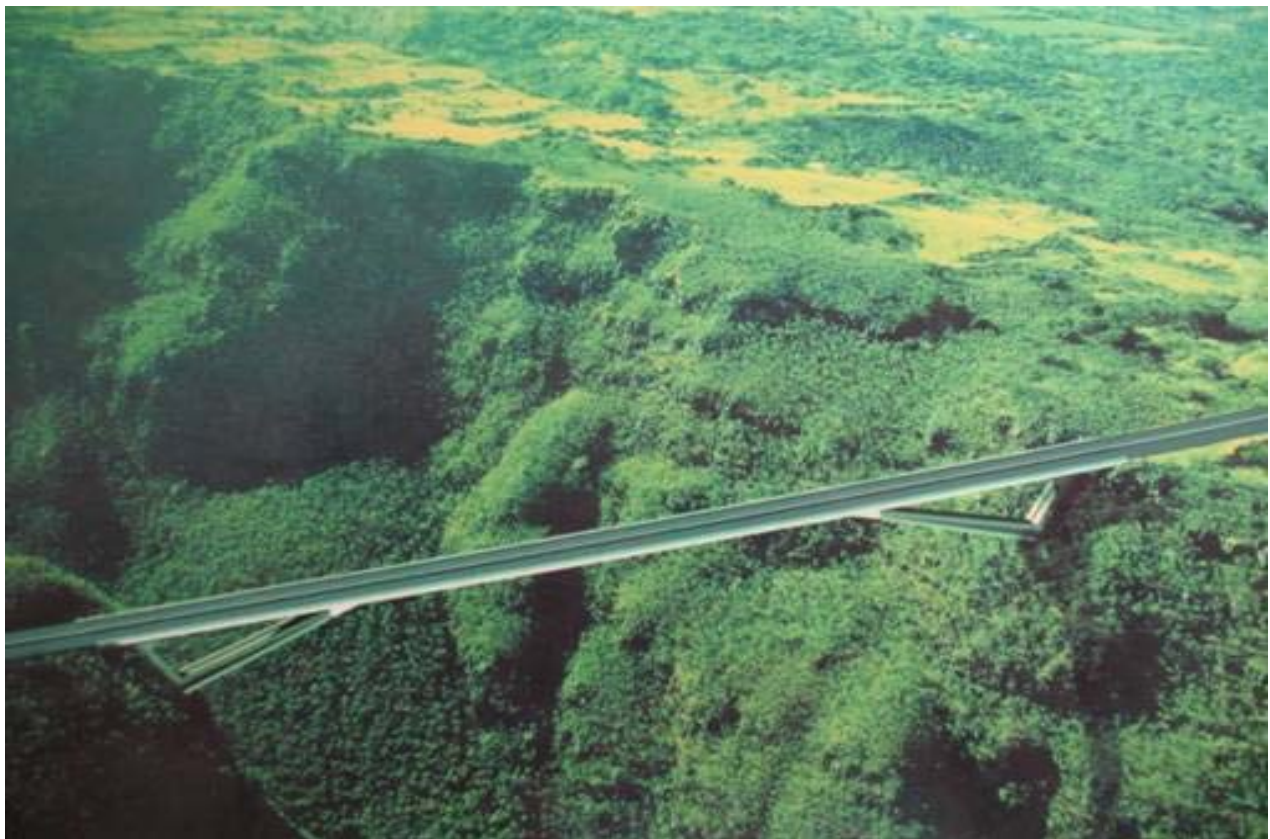
Ouvrage d'art exceptionnel de la Grande ravine

Ce projet a déjà mobilisé des crédits FEDER au titre du DOCUP 2000 – 2006 pour un montant de 104,308 M€. Sur la période en cours, l'enveloppe mobilisée s'élève à 82 M€. S'agissant d'une opération dont le coût global dépasse 50 millions d'euros, le dossier « grand projet » est en cours de préparation en complément de celui agréé au titre de la programmation précédente.